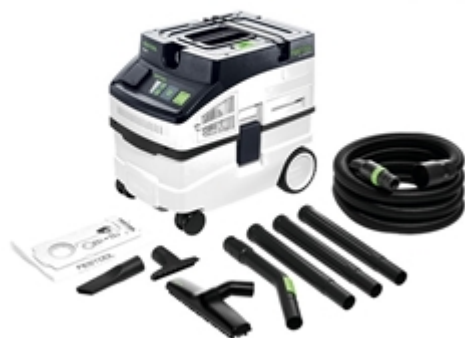
Unità mobile d'aspirazione CT 15 E SET