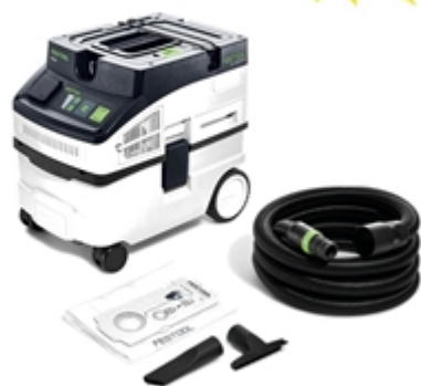
Unità mobile d'aspirazione CT 15 E