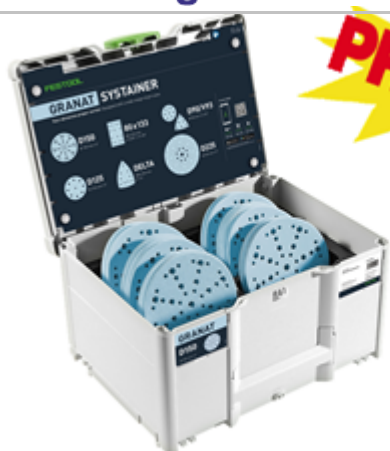
Systainer SYS3 M 237 con abrasivi Granat D150 20x tipo: gr.60-80-120-150-180-220